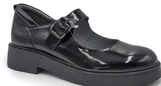
туфли для школьников-девочек: 64951 31-38 натуральная кожа натуральная кожа тэп