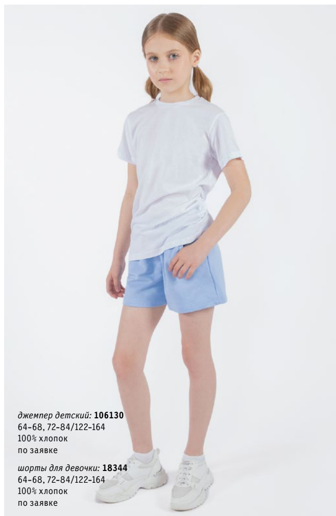
джерпер дeтский: 106130 64-68, 72-84/122-164 100% хлопок по заявке