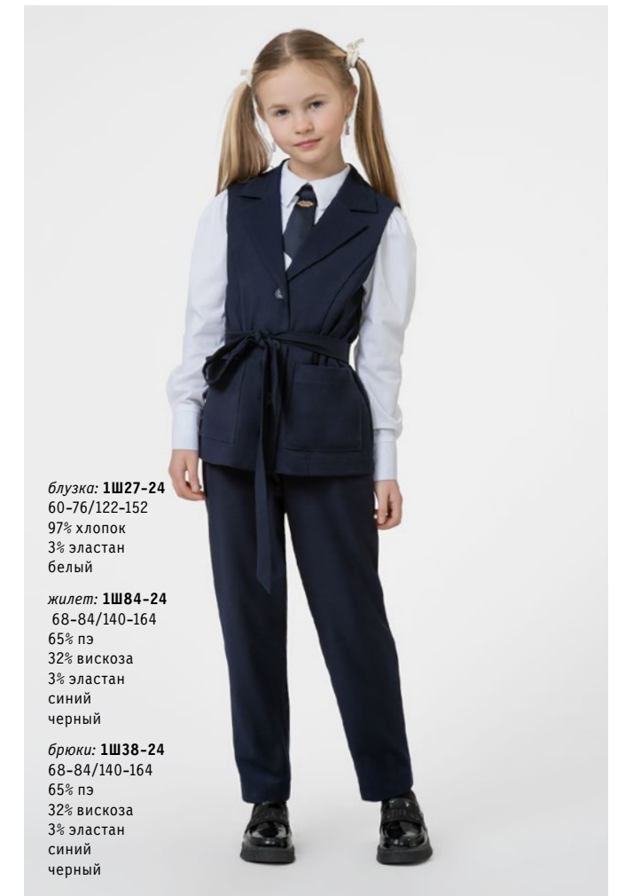
блузка: 1Ш27-24 60-76/122-152 97% хлопок 3% эластан белый