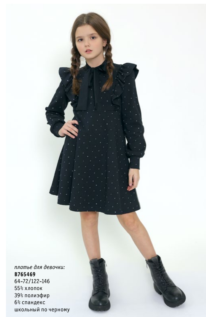
платье для дівочки: В765469 64-72/122-146 55% хлопок 39% поліэфир 6% спандекс школьный по черному

Благодаря хлопку полотно обладает гигиеничностью, хорошо пропускает воздух, а нити полиэфира и спандекса помогают долго сохранить свою первоначальную форму и насыщенность цвета.