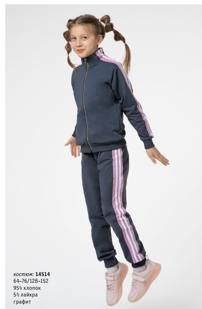
костюм: 14514 64-76/128-152 95% хлопок 5% лайкра графит