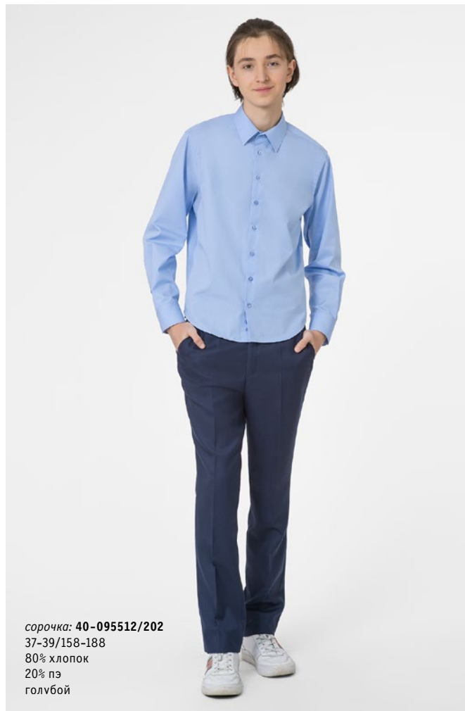
сорочка: 40-095512/202 37-39/158-188 80% хлопок 20% пэ голлбой