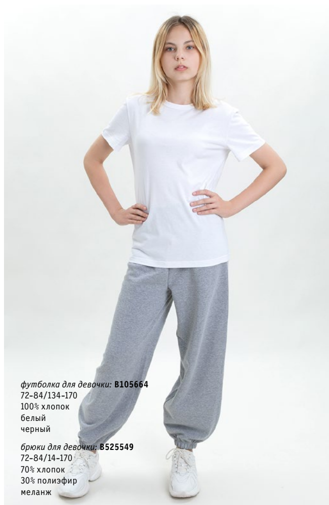
футболка для девочки: B105664 72-84/134-170 100% хлопок белый черный брюки для девочки: B525549 72-84/14-170 70% хлопок 30% полиэфир меланж