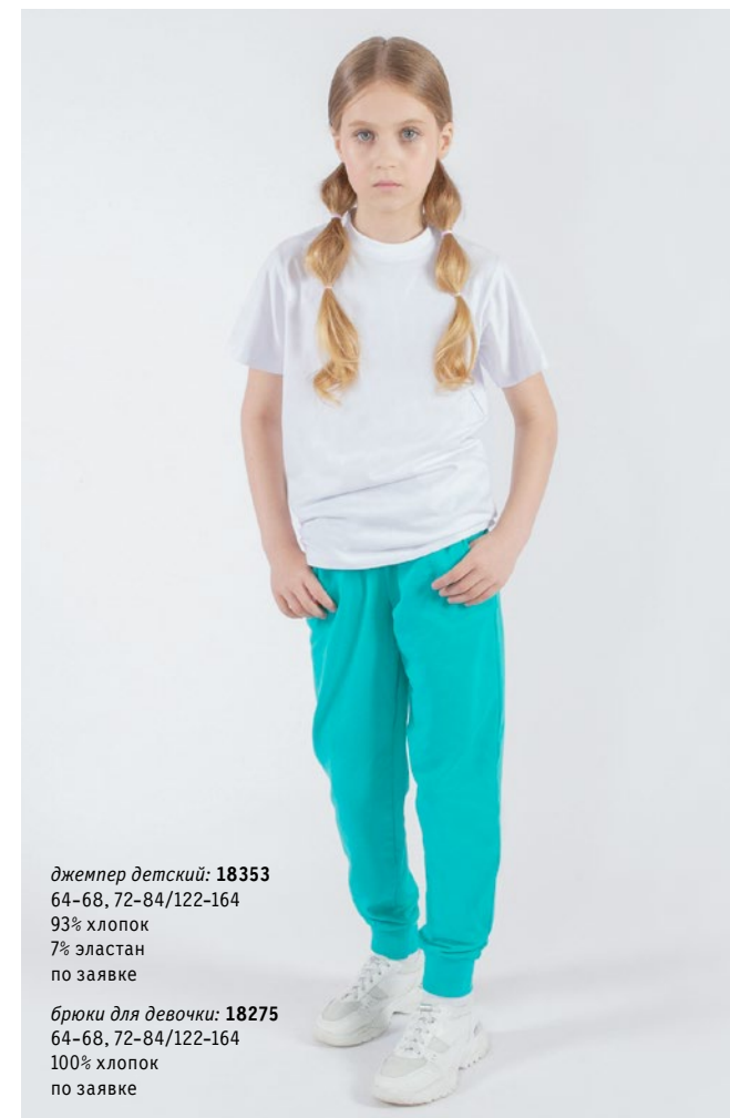
джерпер дeтский: 18353 64-68, 72-84/122-164 93% хлопок 7% эластан по заявке