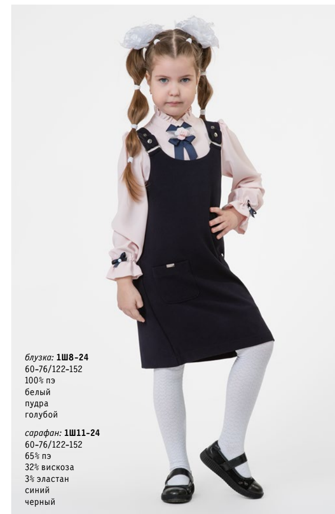
блузка: 1Ш8-24 60-76/122-152 100% пэ белый пудра голубой

С брендом TAMMI девочки выделяются стилем и элегантностью свойственным только истинным леди.