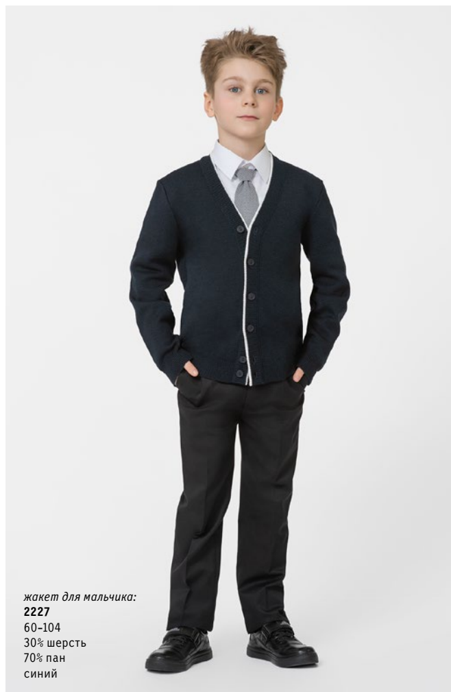
жакет для мальчика: 2227 60-104 30% шерсть 70% пан синий