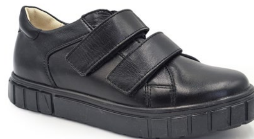
полуботинки для школьников-мальчиков: 64629 33-36 натуральная кожа натуральная кожа тэп