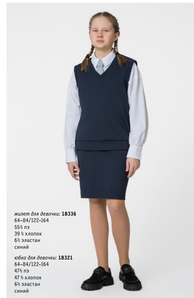
жилет для девочки: 18336 64-84/122-164 55% пэ 39% хлопок 6% эластан синий юбка для девочки: 18321 64-84/122-164 47% пэ 47% хлопок 6% эластан синий

В основе коллекции максимально удобные вещи без ярких акцентов и броских деталей, которые прекрасно дополняют школьный и повседневный гардероб ребенка.