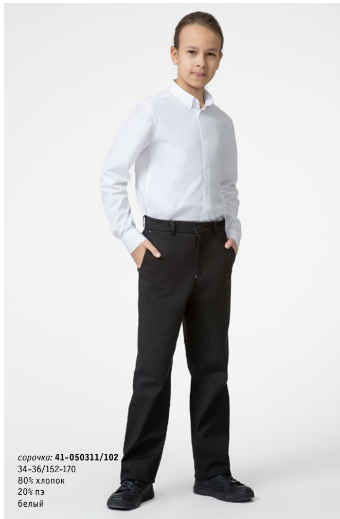
сорочка: 41-050311/102 34-36/152-170 80% хлопок 20% пэ белый