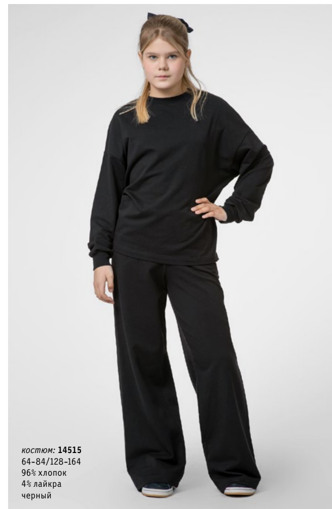
костюм: 14515 64-84/128-164 96% хлопок 4% лайкра черный