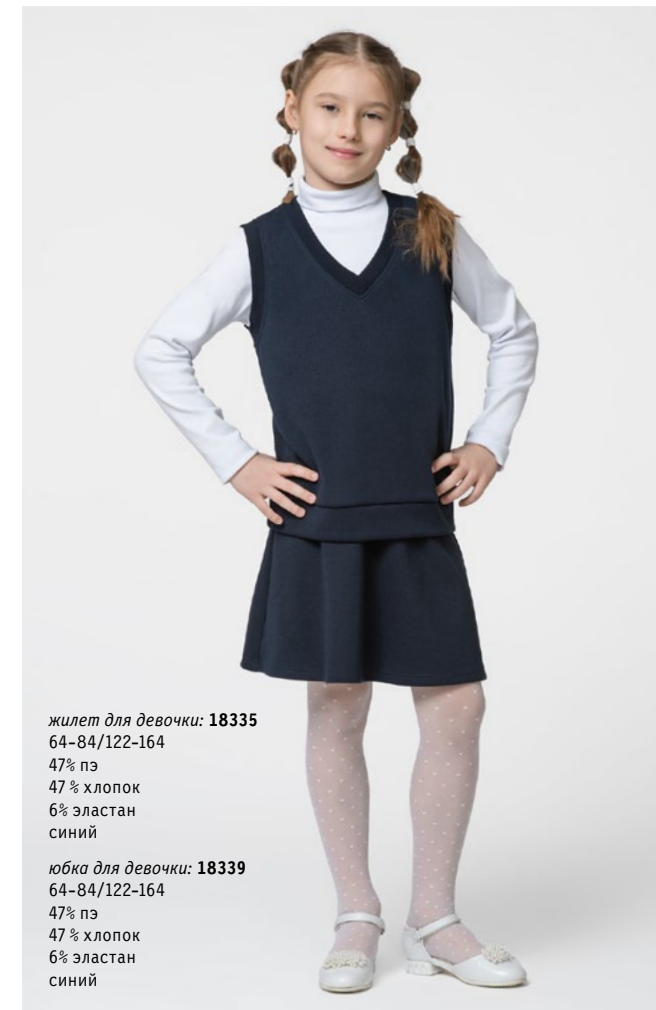
жилет для девочки: 18335 64-84/122-164 47% пэ 47% хлопок 6% эластан синий юбка для девочки: 18339 64-84/122-164 47% пэ 47% хлопок 6% эластан синий