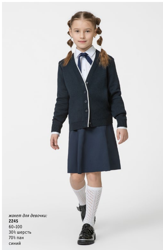
жакет для девочки: 2245 60-100 30% шерсть 70% пан синий