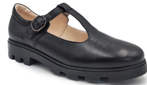
туфли для школьников-девочек: 65090 31-37 натуральная кожа натуральная кожа тэп