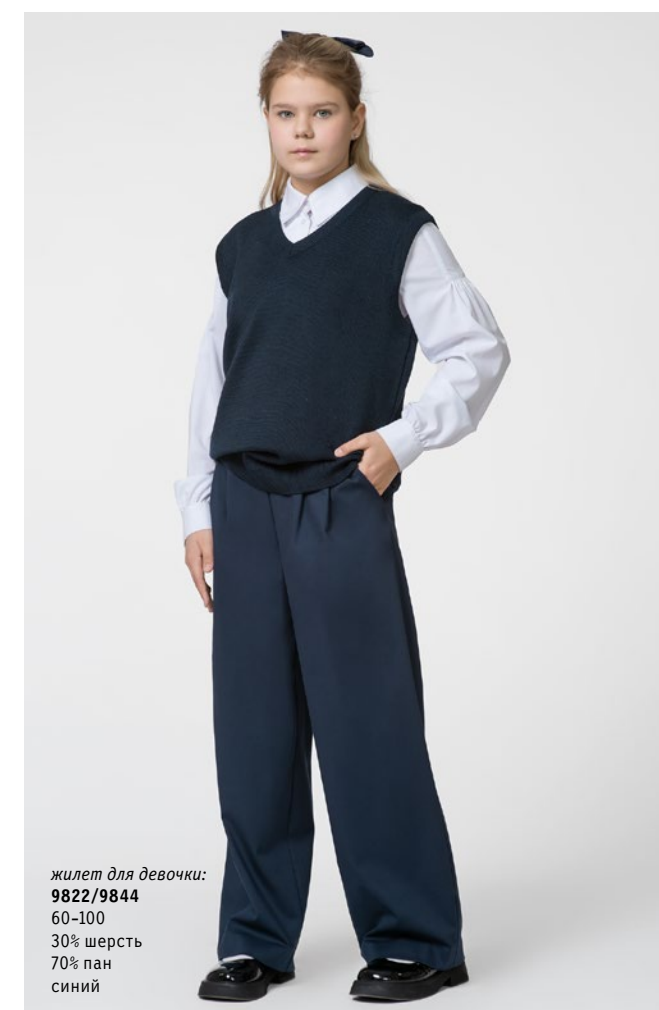
жилет для девочки: 9822/9844 60-100 30% шерсть 70% пан синий