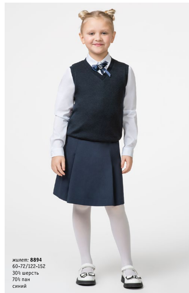
жилет: 8894 60-72/122-152 30% шерсть 70% пан синий