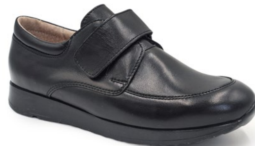
полуботинки для школьников-мальчиков: 64916 32-37 натуральная кожа натуральная кожа тэп