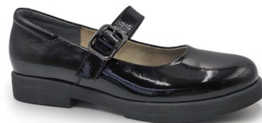
туфли девочки: 65/75091 36-41 натуральная кожа натуральная кожа тэп