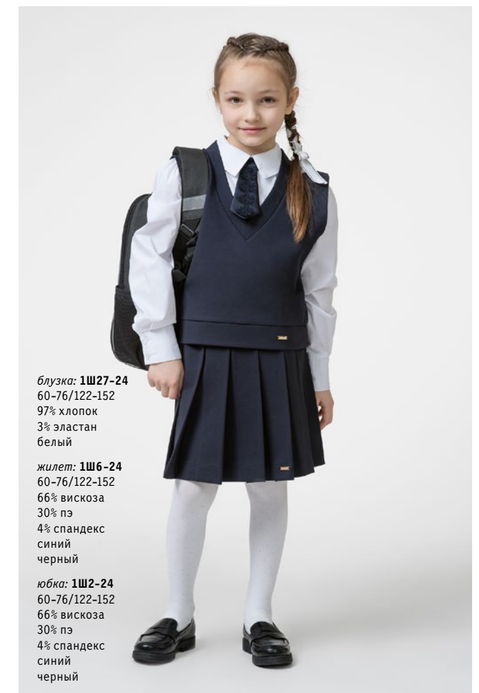
блузка: 1Ш27-24 60-76/122-152 97% хлопок 3% эластан белый