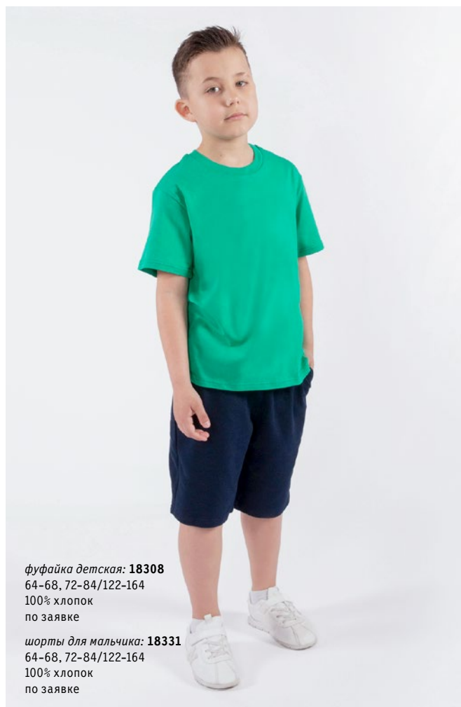
фудайка детская: 18308 64-68, 72-84/122-164 100% хлопок по заявке