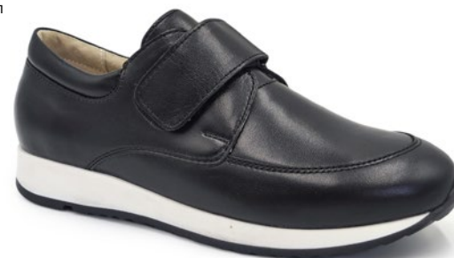
сандалии для первоклашек: 44592 170-200 натуральная кожа натуральная кожа тэп