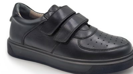
полуботинки для школьников-мальчиков: 64/74816 32-41 натуральная кожа натуральная кожа тэп