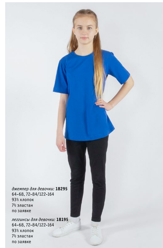
джерпер для девочки: 18295 64-68, 72-84/122-164 93% хлопок 7% эластан по заявке