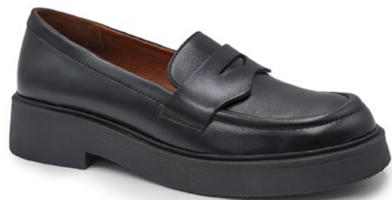
туфли для школьников-девочек: 64923 31-37 натуральная кожа натуральная кожа тэп