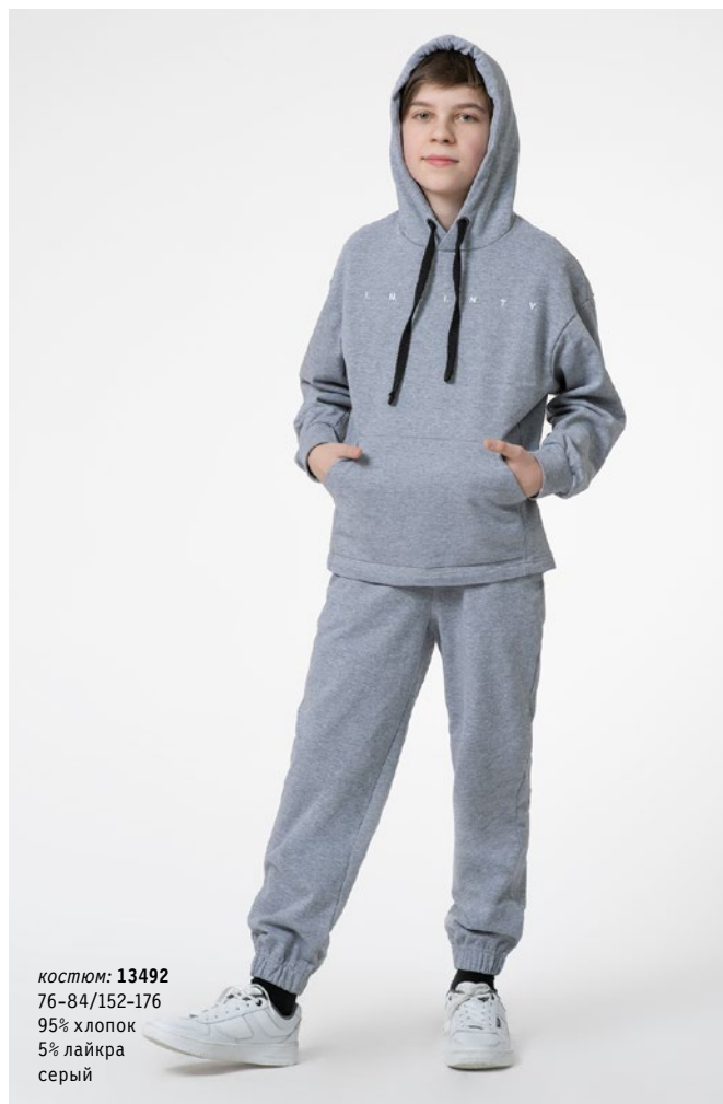
костюм: 13492 76-84/152-176 95% хлопок 5% лайкра серый