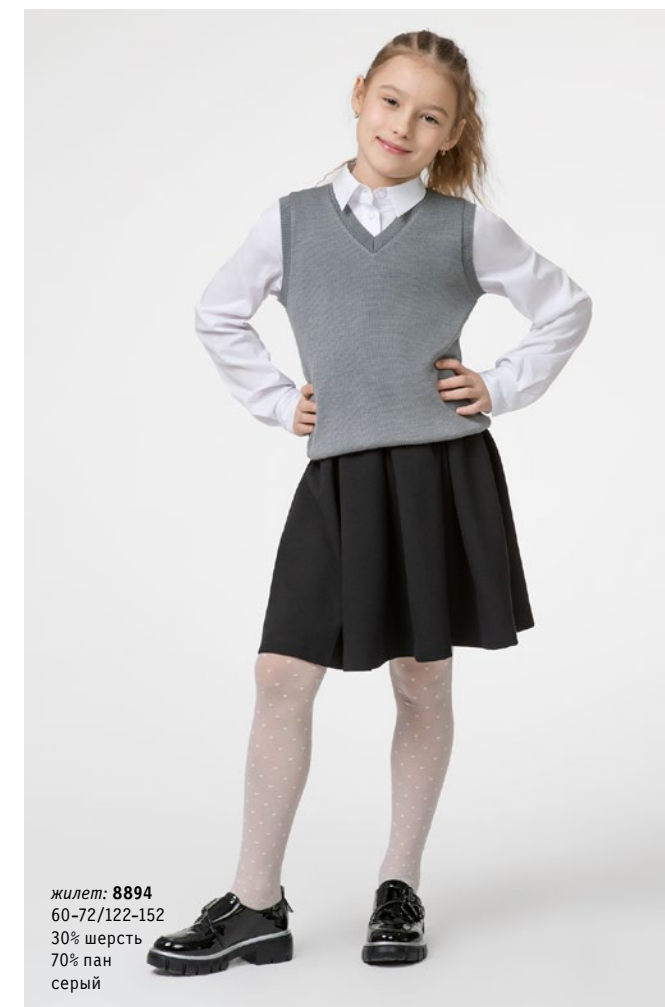
жилет: 8894 60-72/122-152 30% шерсть 70% пан серый