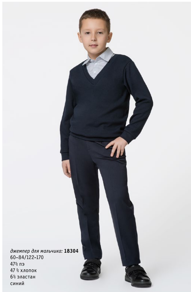
джерсер для мальчика: 18304 60-84/122-170 47% пэ 47% хлопок 6% эластан синий