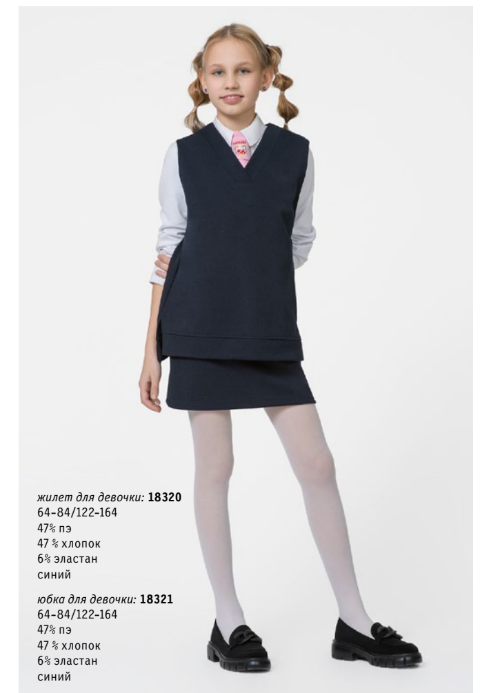
жилет для девочки: 18320 64-84/122-164 47% пэ 47% хлопок 6% эластан синий юбка для девочки: 18321 64-84/122-164 47% пэ 47% хлопок 6% эластан синий