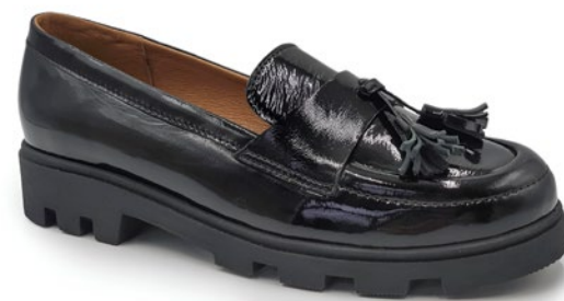
туфли для школьников-девочек: 64920 31-38 натуральная кожа натуральная кожа тэп