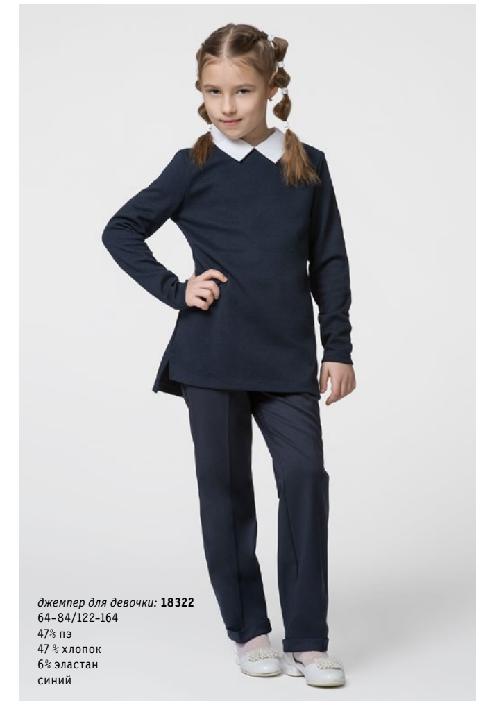
джерсер для девочки: 18322 64-84/122-164 47% пэ 47% хлопок 6% эластан синий