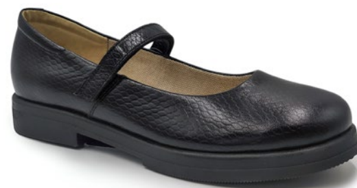
полуботинки для школьников-девочек: 64/74646 31-38 натуральная кожа натуральная кожа тэп