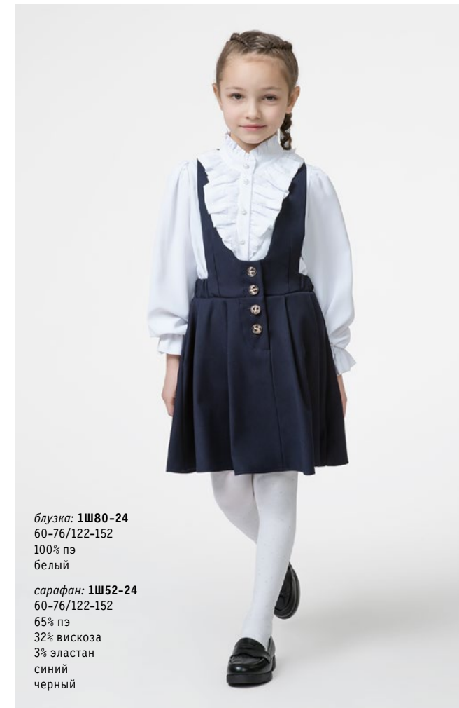
блузка: 1Ш80-24 60-76/122-152 100% пэ белый