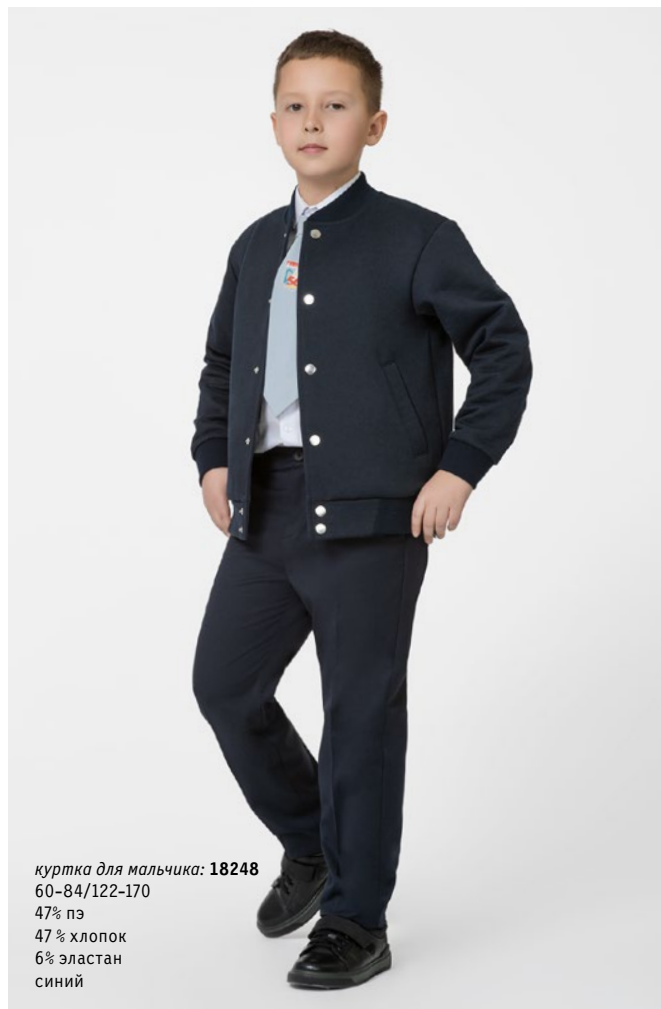
куртка для мальчика: 18248 60-84/122-170 47% пэ 47% хлопок 6% эластан синий