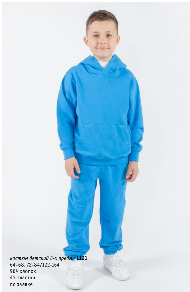
костюм детский 2-х предм.: 1121 64-68, 72-84/122-164 96% хлопок 4% эластан по заявке