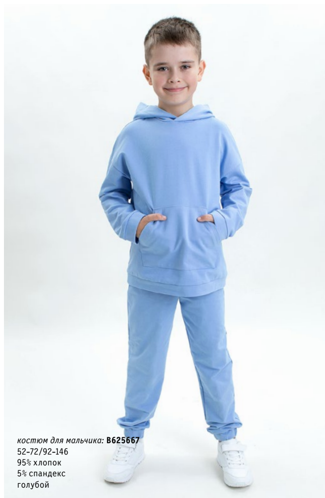
костюм для мальчика: B625667 52-72/92-146 95% хлопок 5% спандекс голубой