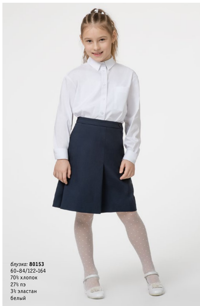
блузка: 80153 60-84/122-164 70% хлопок 27% пэ 3% эластан белый