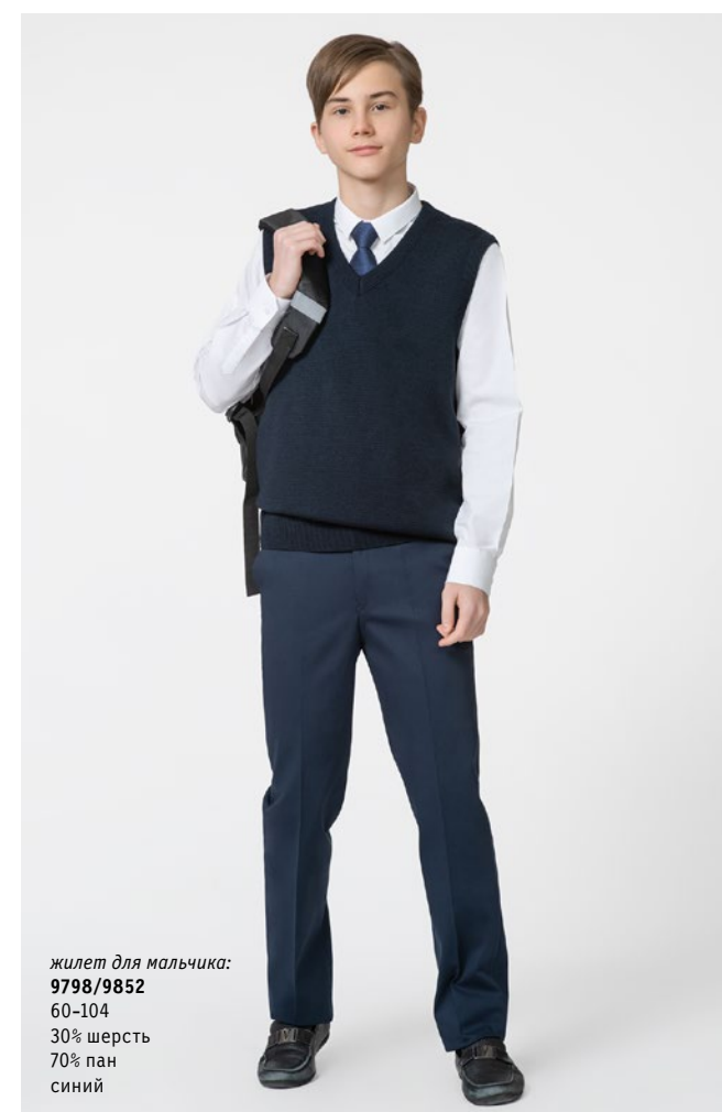
жилет для мальчика: 9798/9852 60-104 30% шерсть 70% пан синий

Ассортимент представлен однотонными жилетами и жилетами с полоской по горловине и низу изделия, а также жакетами с белой полосой. Модели выпускаются из полушерстяной пряжи в матросско-синем цвете.