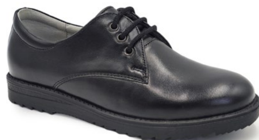
полуботинки для школьников-мальчиков: 64916 32-37 натуральная кожа натуральная кожа тэп