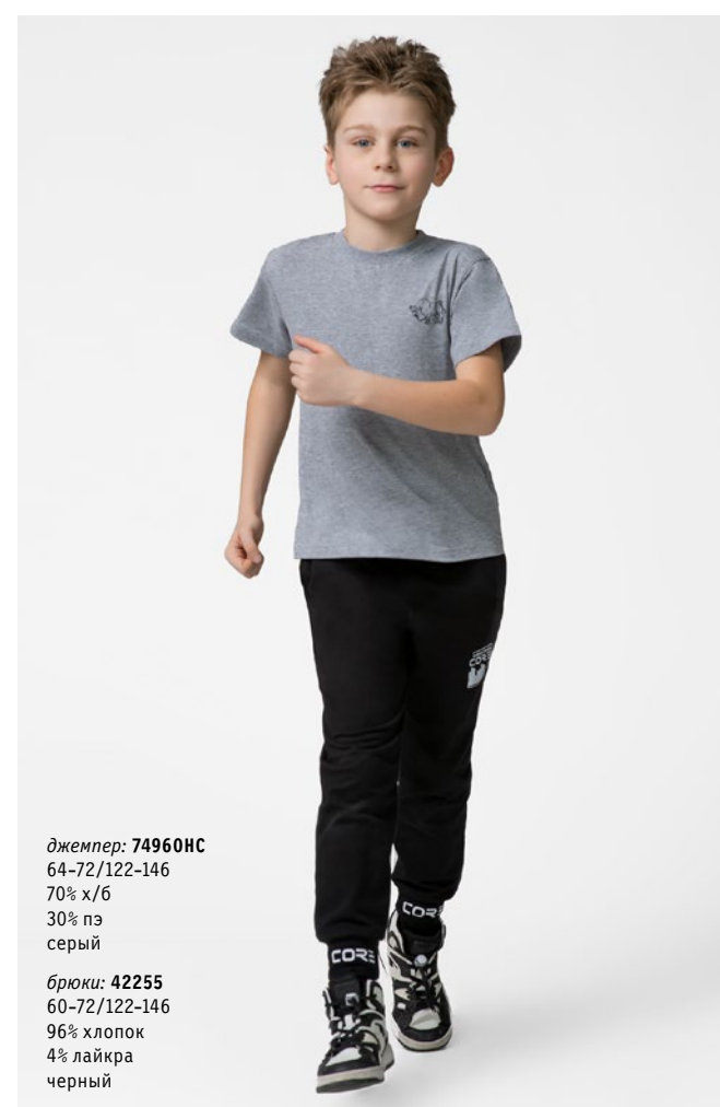
джемпер: 74960НС 64-72/122-146 70% х/б 30% пэ серый

Будьте смелыми, уверенными и готовыми к новым вызовам в одежде от ОАО «Бобруйсктрикотаж».