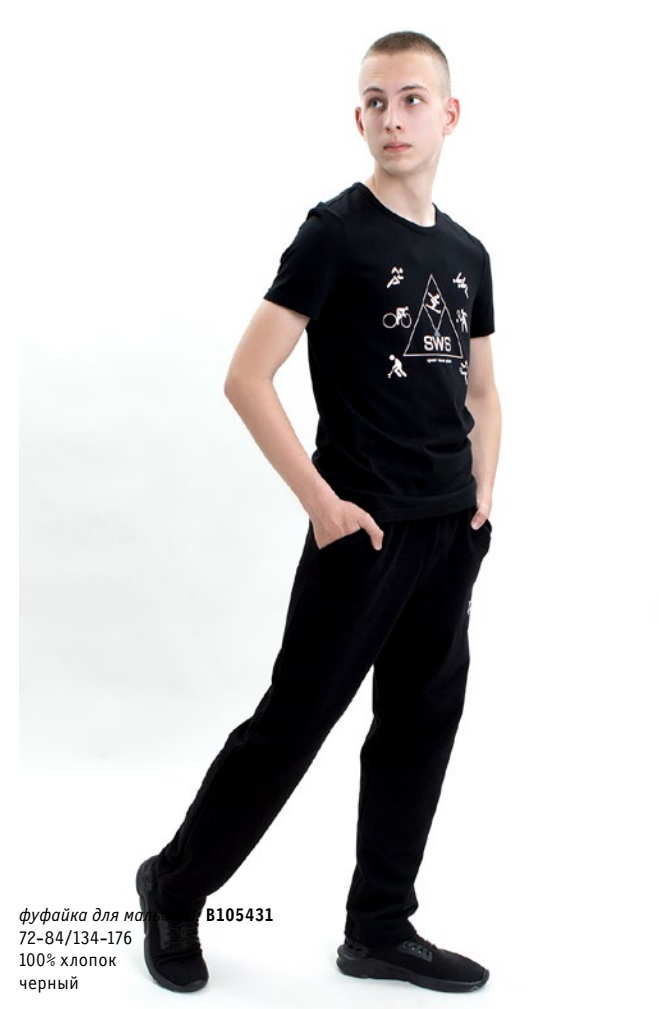
фудфайка для мальчика: B105431 72-84/134-176 100% хлопок черный