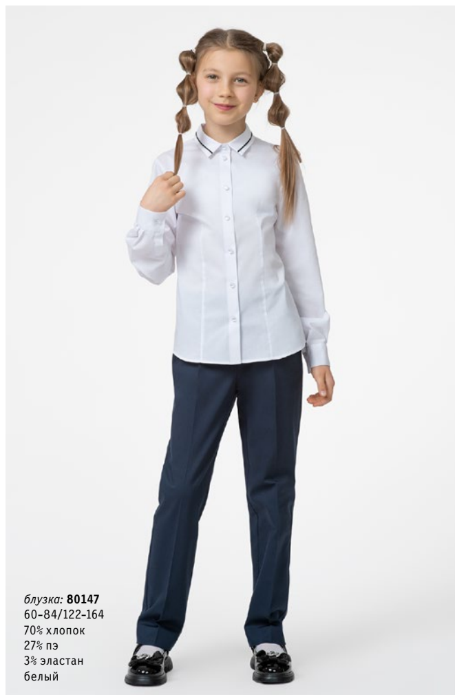
блузка: 80147 60-84/122-164 70% хлопок 27% пэ 3% эластан белый