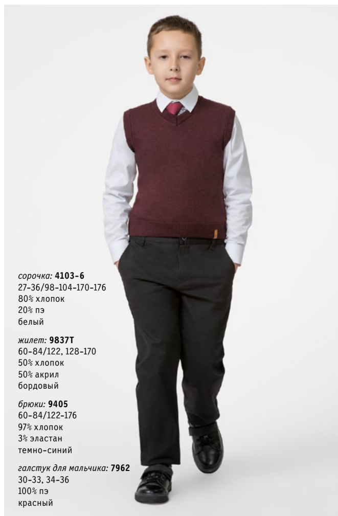
сорочка: 4103-6 27-36/98-104-170-176 80% хлопок 20% пэ белый