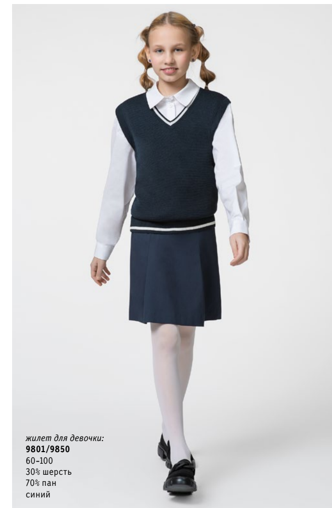
жилет для девочки: 9801/9850 60-100 30% шерсть 70% пан синий