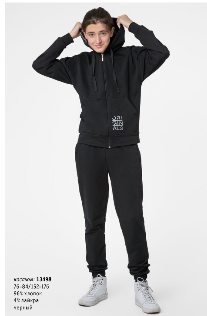
костюм: 13498 76-84/152-176 96% хлопок 4% лайкра черный