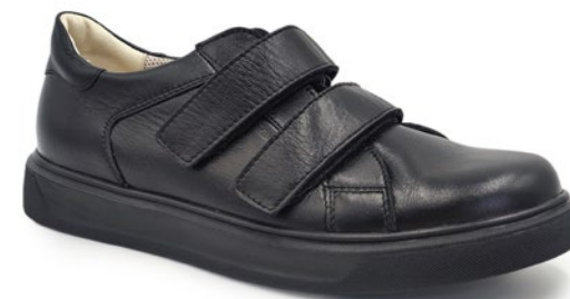
полуботинки для школьников-мальчиков: 65/75039 32-43 натуральная кожа натуральная кожа тэп