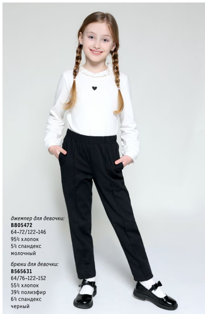
джерсер для дівочки: В805472 64-72/122-146 95% хлопок 5% спандекс молочный