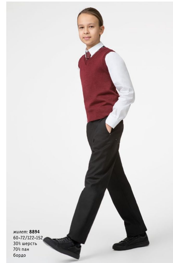
жилет: 8894 60-72/122-152 30% шерсть 70% пан бордо