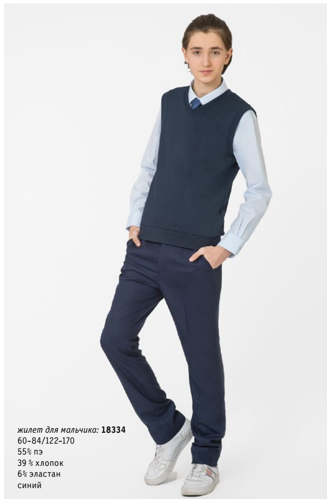
жилет для мальчика: 18334 60-84/122-170 55% пэ 39% хлопок 6% эластан синий