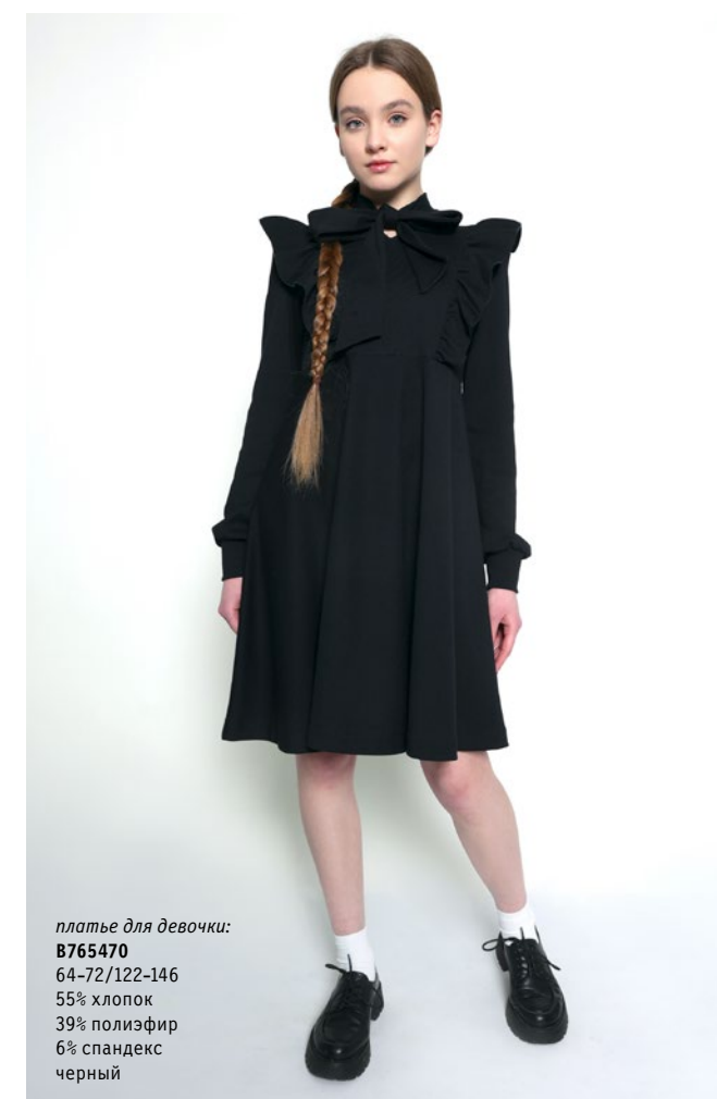
платье для дівочки: В765470 64-72/122-146 55% хлопок 39% поліэфир 6% спандекс черный