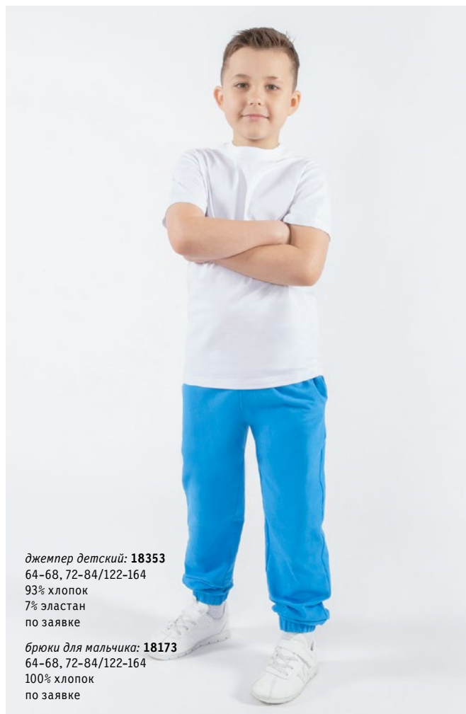
джерпер дeтский: 18353 64-68, 72-84/122-164 93% хлопок 7% эластан по заявке