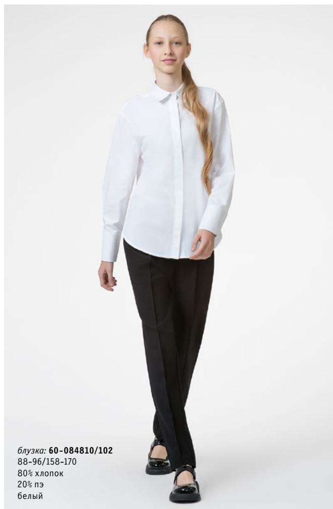
блузка: 60-084810/102 88-96/158-170 80% хлопок 20% пэ белый