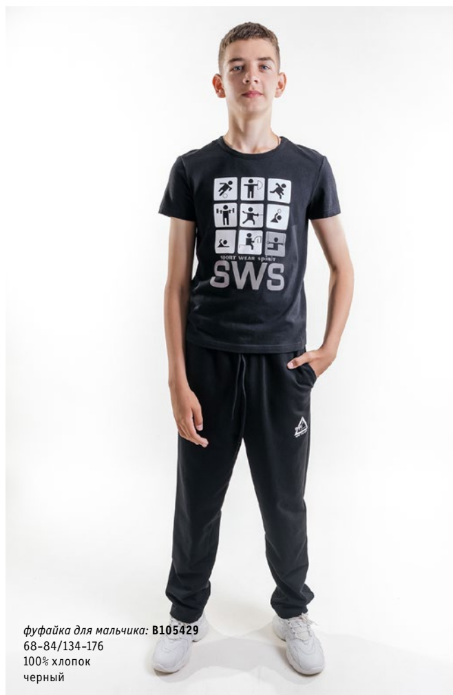
фудфайка для мальчика: B105429 68-84/134-176 100% хлопок черный