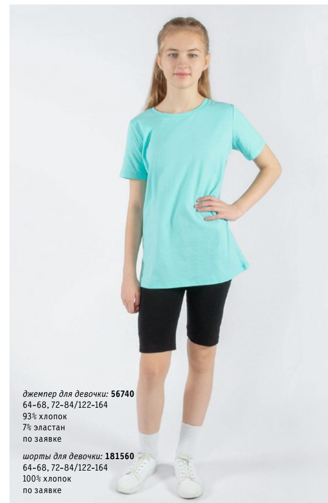
джерпер для девочки: 56740 64-68, 72-84/122-164 93% хлопок 7% эластан по заявке