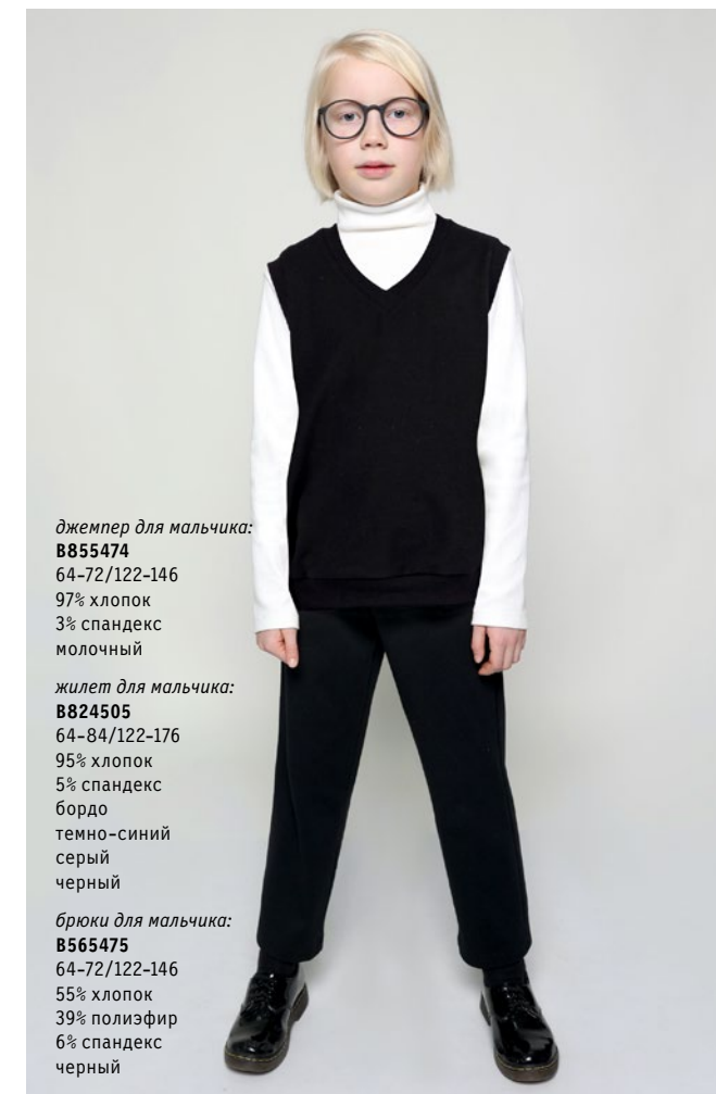
джерсер для мальчика: В855474 64-72/122-146 97% хлопок 3% спандекс молочный