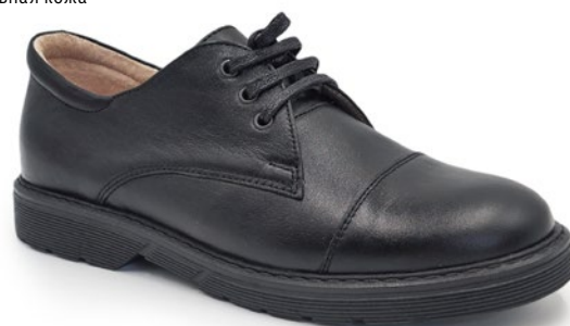
полуботинки для школьников: 64780 32-37 натуральная кожа натуральная кожа полиуретан