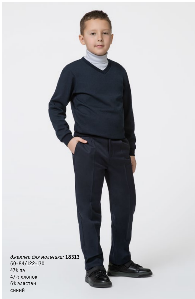
джерсер для мальчика: 18313 60-84/122-170 47% пэ 47% хлопок 6% эластан синий