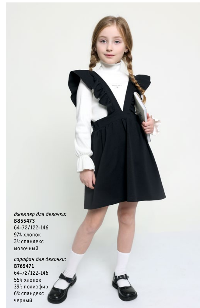
джерсер для дівочки: В855473 64-72/122-146 97% хлопок 3% спандекс молочный