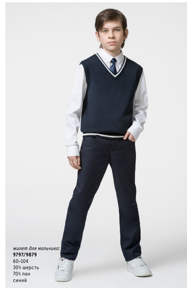
жилет для мальчика: 9797/9879 60-104 30% шерсть 70% пан синий