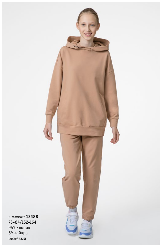
костюм: 13488 76-84/152-164 95% хлопок 5% лайкра бежевый