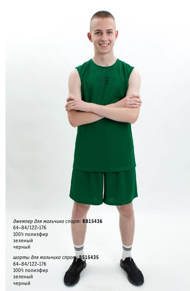
джерсер для мальчика спорт: B815436 64-84/122-176 100% полиэфир зеленый черный шорты для мальчика спорт: B515435 64-84/122-176 100% полиэфир зеленый черный