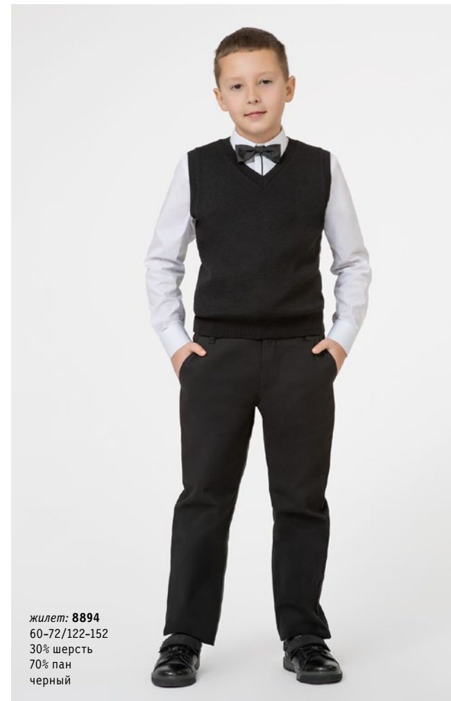
жилет: 8894 60-72/122-152 30% шерсть 70% пан черный

Все изделия выполнены из высококачественных натуральных материалов с добавлением шерсти, обеспечивая детям комфорт и свободу движения.