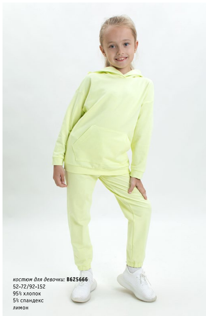
костюм для девочки: B625666 52-72/92-152 95% хлопок 5% спандекс лимон