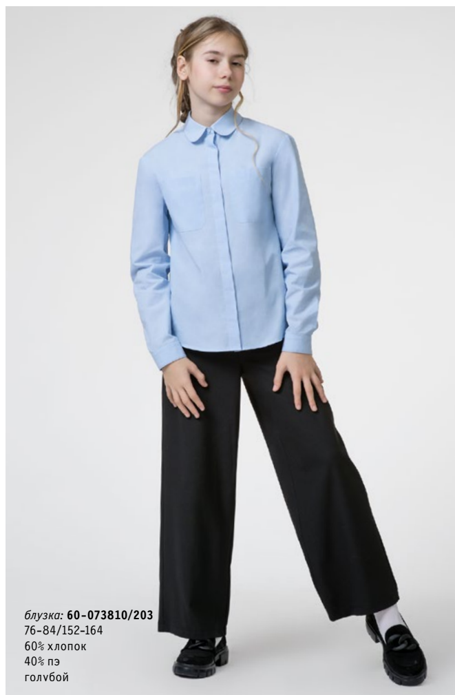
блузка: 60-073810/203 76-84/152-164 60% хлопок 40% пэ голлбой