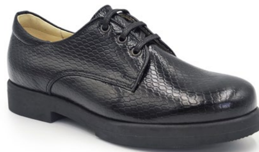
полуботинки для школьников: 64876 32-35 натуральная кожа натуральная кожа + текстильный материал тэп