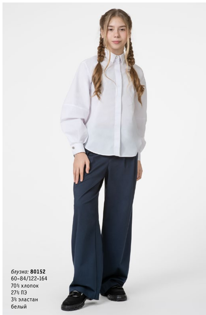
блузка: 80152 60-84/122-164 70% хлопок 27% пэ 3% эластан белый