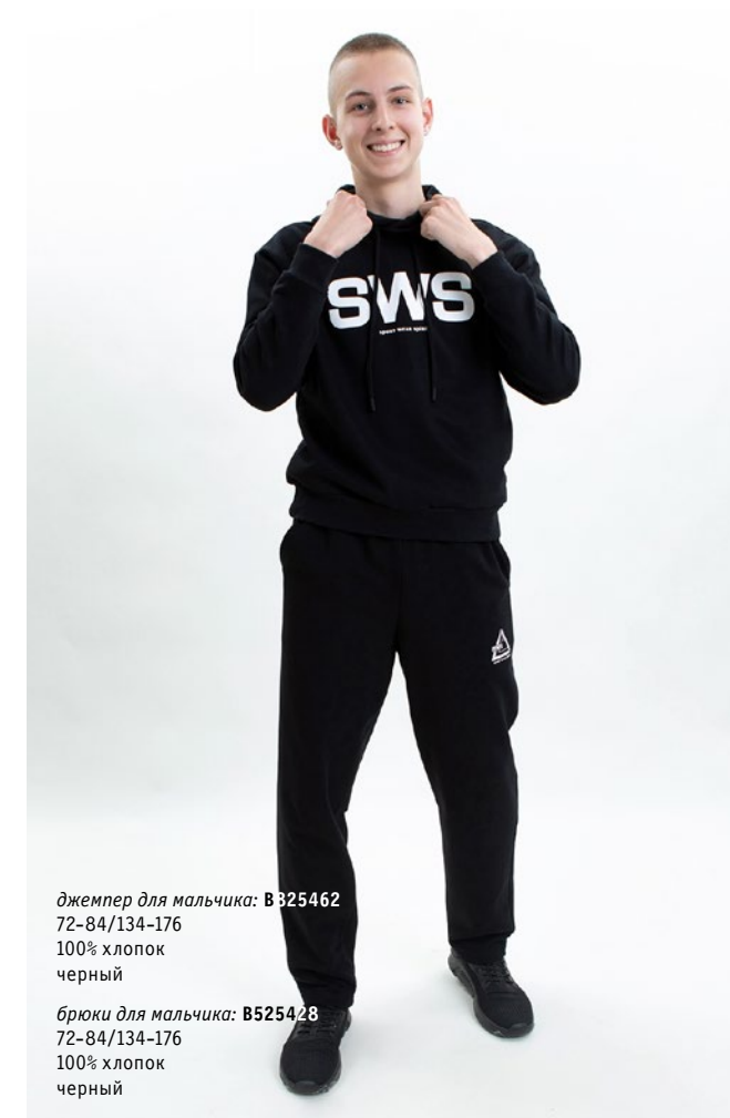
джерсер для мальчика: B325462 72-84/134-176 100% хлопок черный брюки для мальчика: B525428 72-84/134-176 100% хлопок черный