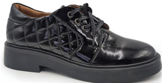
полуботинки для школьников-мальчиков: 64600 33-36 натуральная кожа натуральная кожа тэп