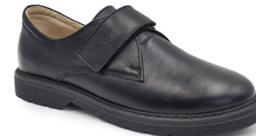
полуботинки девочки: 64/74934 36-41 натуральная кожа натуральная кожа тэп