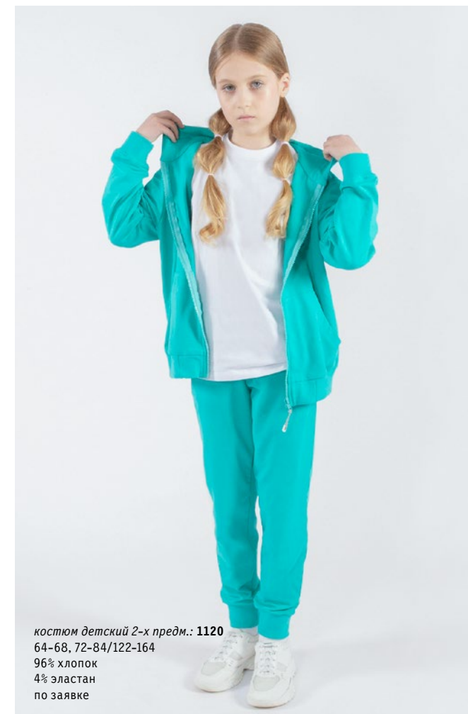
костюм детский 2-х предм.: 1120 64-68, 72-84/122-164 96% хлопок 4% эластан по заявке